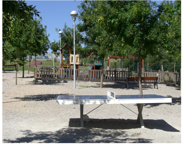
EQUIPAMIENTO DEPORTIVO EN PARQUE DE VALDEIGLESIAS EN NAVATEJERA