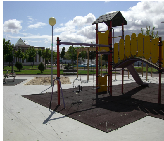
PARQUES INFANTILES EN VILLASINTA DE TORÍO Y PARQUE DE LA CASA DE CULTURA DE VILLAQUILAMBRE