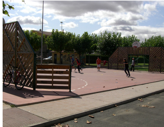
ZONA DE LAS "PARADINAS" DE VILLARRODRIGO DE LAS R. Y PARQUE DE VILLOBISPO DE LAS REGUERAS