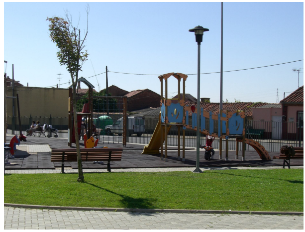
PARQUE INFANTIL DEL CARDADAL Y PARQUE INFANTIL AL LADO DEL CENTRO CÍVICO EN NAVATEJERA