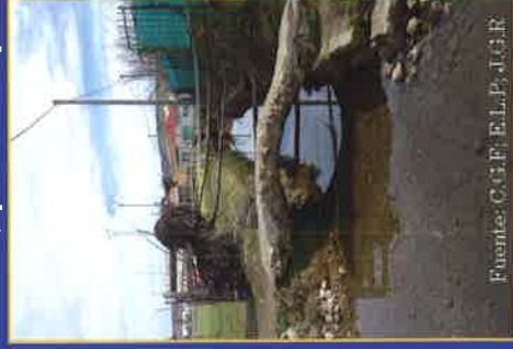
Puentes: C. G. F. E. L. A. P. U. E. R. O.

Villaobispo y León, para desembocar en este río a la altura de Puentecastro tras pasar por la Candamia.